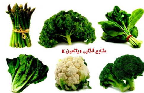
منابع غذایی ویتامین K

نخودفرنگی، هویج، سیب زمینی، کرفس، خیار پوست کنده، ذرت، بادمجان، گوجه فرنگی، فلفل و کدو سبز